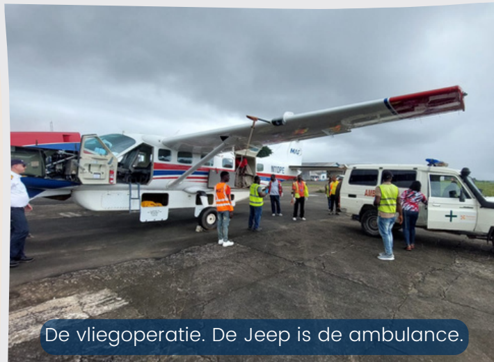
De vliegoperatie. De Jeep is de ambulance.

In de vorige nieuwsbrief vroegen we gebed om de komende verkiezingen. Een 2e ronde was nodig en de oppositiepartij had op een haar na gewonnen. Het was spannend wat er daarna zou gaan gebeuren. Maar we zijn erg opgelucht dat de vorige president al snel zijn verlies toegaf en het best rustig bleef. Inmiddels is de nieuwe president aangetreden.