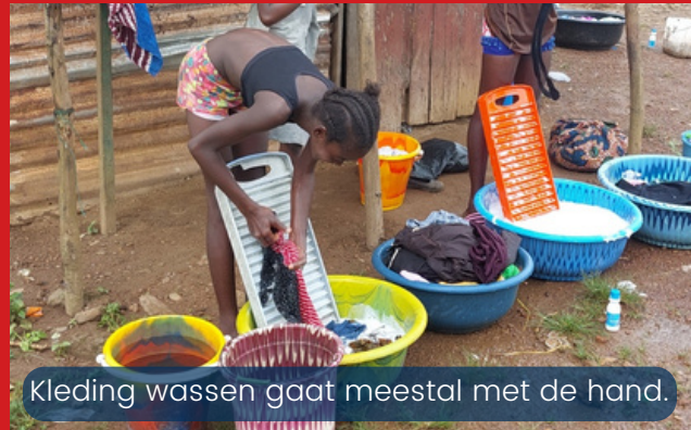
Kleding wassen gaat meestal met de hand.