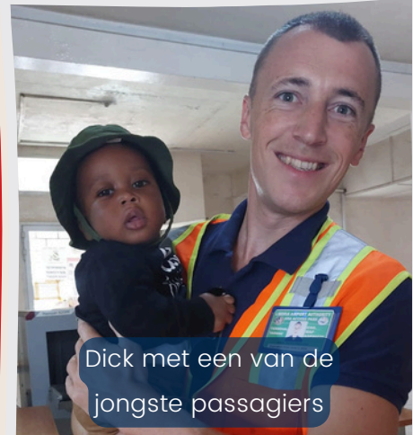
Dick met een van de jongste passagiers

We kijken ernaar uit om deze zomer een paar weekjes in Nederland te zijn. Bijkomen en opladen voor een volgend jaar in Liberia. Meer hierover weten, kijk op onze blog.