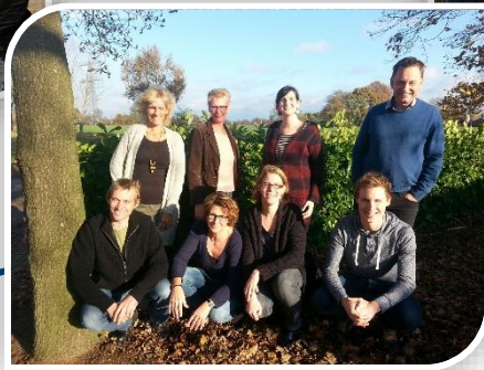
Laatste gezinsfoto voor vertrek uit NL