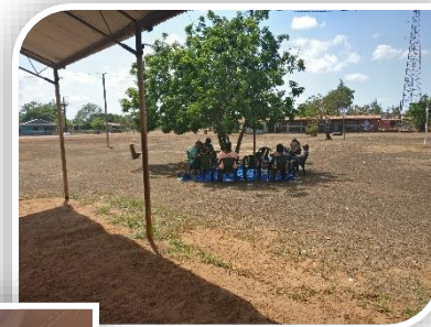
Kerk onder de boom in Ramingining