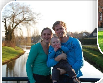
Eerste gezinsfoto voor MAF