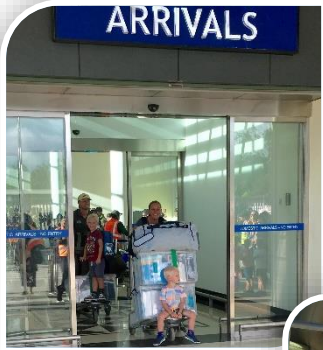
Aankomst in PNG