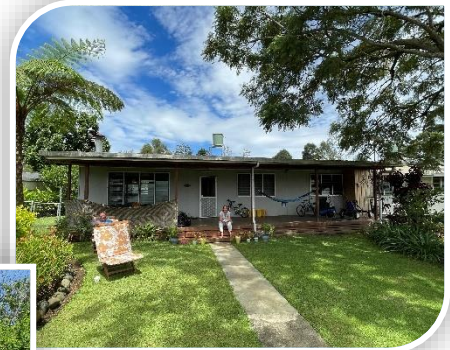
Ons nieuwe thuis in Mt Hagen