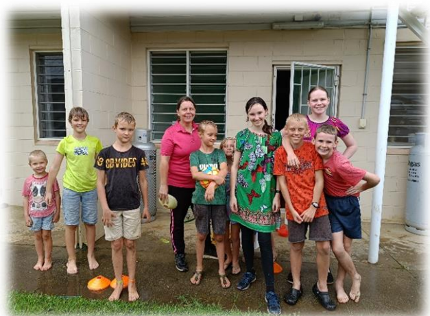
Al deze kinderen van de 'sport-club' zijn vanaf Juli 2024 niet meer in Mount Hagen.