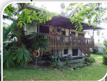
Ons nieuwe thuis in Wewak