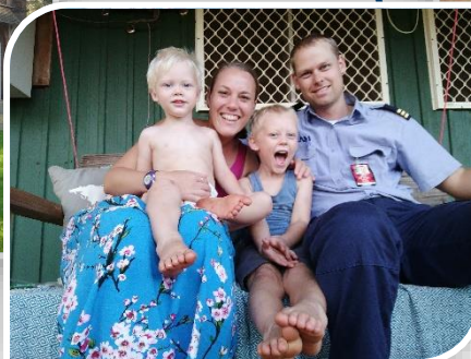
Thuis in Ramingining, Arnhemland