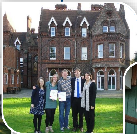
All Nations bijbelschool in UK