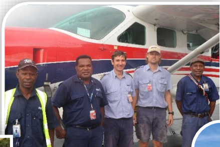
MAF team in Wewak